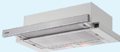
HST 60 X