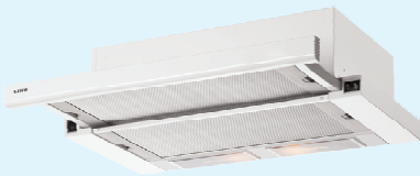
HST PLUS 60 WH