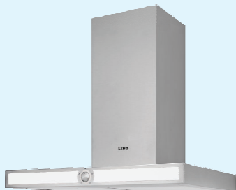
H 60PB W/X